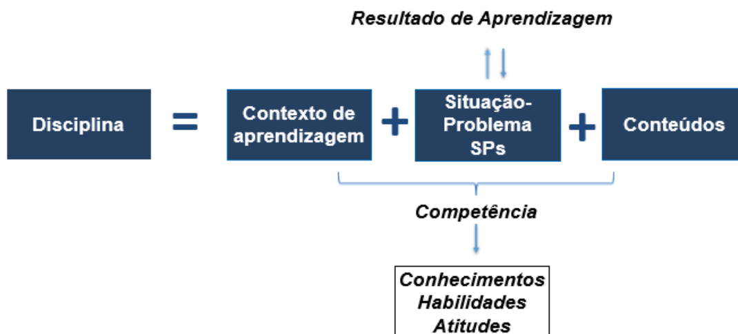
Figura 1: Os Elementos Norteadores do Design Instrucional do Modelo Acadêmico da Ampli.

Portanto, a metodologia de ensino da Pitágoras Ampli desenvolve as competências, as habilidades e as atitudes nos alunos, permitindo que ocupem o protagonismo no processo de ensino e aprendizagem, a partir de situações-problema e contextos de aprendizagem, que visam refletir situações prático-profissionais, ou seja, exemplos de contextos e situações que o egresso poderá enfrentar na prática. Para isso, as disciplinas são construídas a partir de uma metodologia adaptada de ferramentas de gestão denominada Balanced Scorecard (BSC) desenvolvida pelos professores da Harvard Business School (HBS), Robert Kaplan e David Norton. O BSC da disciplina é o documento norteador para a produção dos materiais didáticos, buscando apresentar todos os elementos necessários para compatibilizar aprofundamento com coerência, aliando teoria e prática.